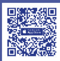
ดาวน์โหลด Application IR PLUS AM ระบบ iOS 14.5 ขึ้นไป

ในวันประชุม ผู้ถือหุ้นเข้าสู่ Application IR PLUS AGM และกรอกรหัส Pincode เพื่อลงทะเบียนเข้าร่วมประชุม