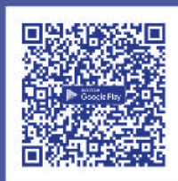
ดาวน์โหลด Application IR PLUS AM ระบบ Android Ver.8 ขึ้นไป