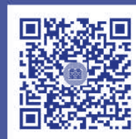
คู่มือผู้ใช้งาน ระบบ IR PLUS AGM TH และ ENG